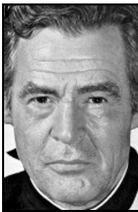
ROBERT RYAN (Robert Bushnell Ryan)